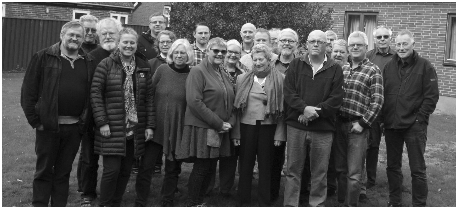
Deltagerne i Danmarks Lejerforeningers landsmøde 2016